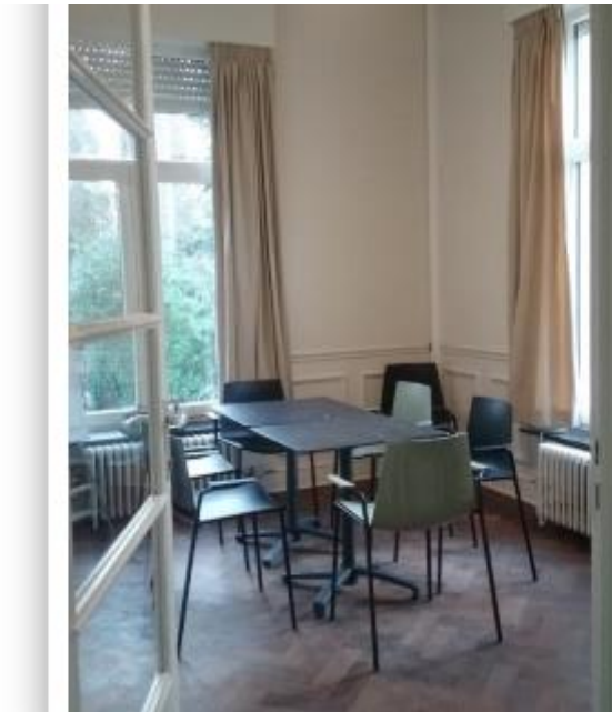
Bar – 16 zitplaatsen