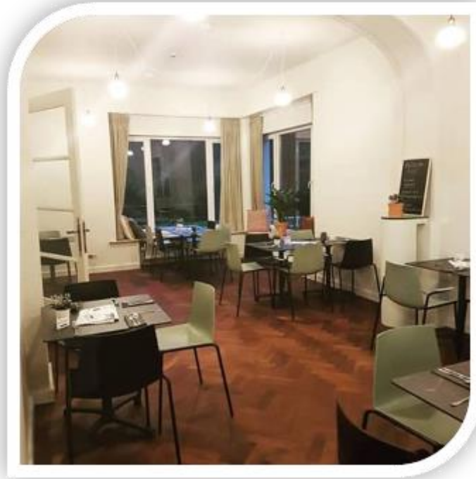
Vergaderzaal groot - 16 zitplaatsen